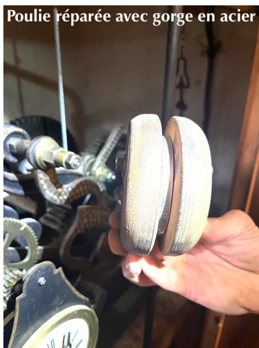
Poulie réparée avec gorge en acier

La deuxième tranche de travaux dans le clocher concerne la remise en état de l'ensemble campanaire classé Monument historique qu'il abrite. Les battants et les marteaux des cloches ont été emportés le 30 mars pour être rechargés en métal et réparés dans l'usine Bodet à côté de Cholet. Leur retour est prévu par cette entreprise à la fin du mois d'août et les travaux de nettoyage des cloches et des jous, de changement des brides seront effectués au début septembre.