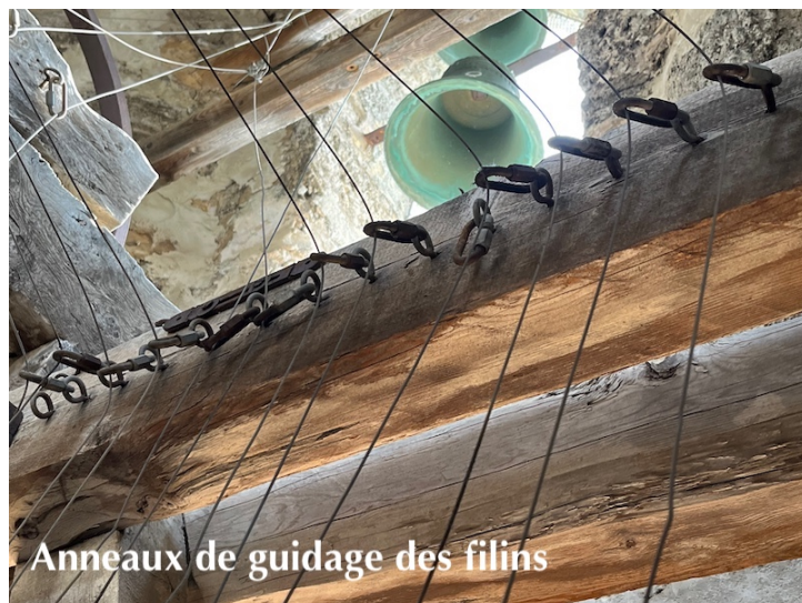
Anneaux de guidage des filins

Entretemps, l'horloger, monsieur Desmarquest est venu plusieurs fois afin d'effectuer un nettoyage complet de l'horloge mécanique et de la machine à carillonner. Certaines pièces ont été refaites. Tous les mécanismes ont été huilés, les filins ont été réparés et beaucoup de petites pièces ont été contrôlées ou changées, comme des anneaux de guidage ou des bagues en porcelaine par lesquelles passent les filins. L'horloger reviendra en septembre pour effectuer les derniers travaux de réglage lorsque tout sera remis en place et instaurer une liaison parfaite entre les différents éléments de cet ensemble.