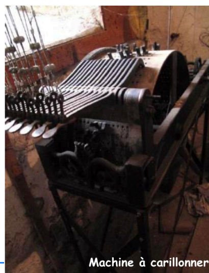
Machine à carillonner

Après plusieurs visites d'artisans spécialisés : horlogers et campanistes, il est apparu que de nombreuses altérations dues essentiellement à l'usure du temps affectaient les installations présentes dans le clocher : une horloge mécanique Mayet de 1911, un cylindre à carillon qui permettait de jouer des mélodies manuellement et l'ensemble des 9 cloches dont la plus ancienne du fondeur lyonnais Burdin date de 1866. Les autres provenant de la